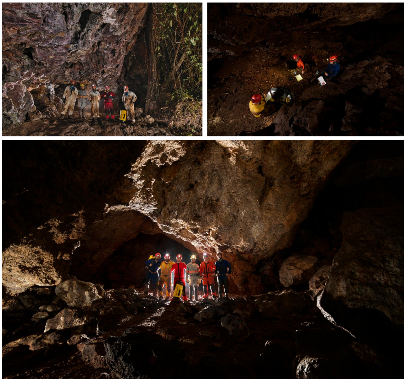
Figura 3. Equipe do projeto – S11B, FLONA Carajás

As campanhas de campo estão detalhadas nos informes trimestrais e nos relatórios mensais (Anexo I) emitidos pelo Dr. Luís B. Piló, documentos executivos que relatam os avanços do projeto (organização e execução) e resultados preliminares.