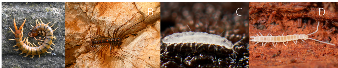
Figura 2. Representantes do grupo dos quilópodes, paurópodes e sinfílos. A. lacraia (quilópode), B. cabeluda (quilópode), C. paurópode e D. sinfílo.

Diplópodes: apresentam os segmentos do corpo fundidos, os chamados diplossegmentos. Dessa forma, cada diplossegmento possuem dois pares de pernas, por isso o nome diplópodes (diplo = dois, podes = pernas). São animais detritívoros (alimentam-se de matéria orgânica em decomposição, Figura 3a); movimentam-se lentamente e vivem no solo e/ou folhiço (Figura 3b). Em regiões em que as minhocas são escassas, os diplópodes são os principais formadores de solo, pois convertem a matéria vegetal em húmus.