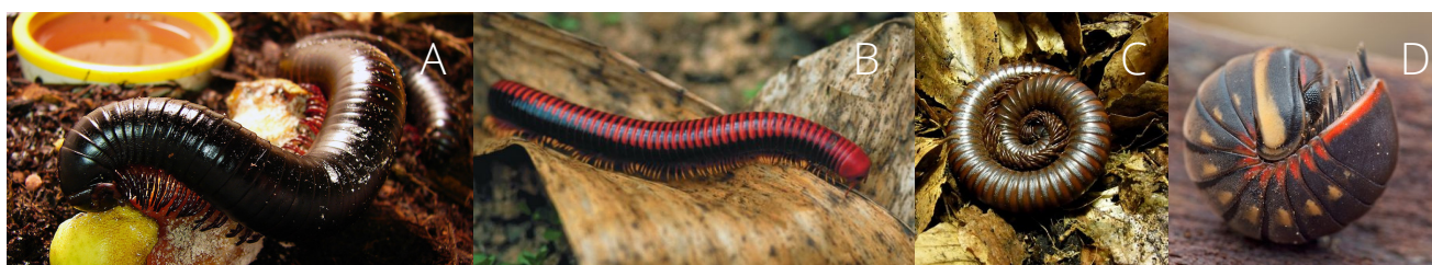
Figura 3. Diplópodes. A: espécime se alimentando de matéria orgânica em decomposição; B: espécime no folhiço; C: espécime enrolado em forma de espiral e D: espécime enrolado em forma de bola.

Diplópodes: apresentam os segmentos do corpo fundidos, os chamados diplossegmentos. Dessa forma, cada diplossegmento possuem dois pares de pernas, por isso o nome diplópodes (diplo = dois, podes = pernas). São animais detritívoros (alimentam-se de matéria orgânica em decomposição, Figura 3a); movimentam-se lentamente e vivem no solo e/ou folhiço (Figura 3b). Em regiões em que as minhocas são escassas, os diplópodes são os principais formadores de solo, pois convertem a matéria vegetal em húmus.