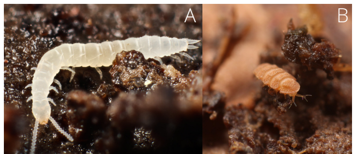
Figura 6. Sínfilos e paurópodes no solo.

Paurópodes: são animais minúsculos (0,3 a 2mm de comprimento), sem olhos, que ocorrem principalmente em solos úmidos e no folhíço. Alimentam-se de fungos e matérias animais e vegetais em decomposição (Figura 6b).