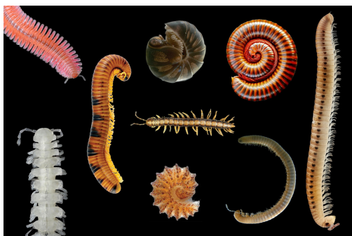
Figura 1. Representantes do grupo dos diplópodes (piolho-de-cobra).

Miriápodes são invertebrados terrestres com mais de 16.000 espécies descritas em todo mundo. Compreendem os quilópodes (centopéias, Figura 2 a e b), diplópodes (piolhos-de-cobra, gongolos ou embuas, Figura 1), paurópodes (Figura 2c) e sinfílos (Figura 2d). Tem como característica o corpo dividido em cabeça e tronco com muitas pernas articuladas.