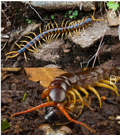
Figura 5. Quilópodes. A: espécime no folhíço; B: espécime se alimentando.

Quilópodes: são velozes predadores, com um par de pernas por segmento e garras de veneno no primeiro par de pernas, denominadas forcípulas (Figura 5a). Quando ameaçados atacam usando suas garras de veneno, causando uma picada muito dolorosa. Alimentam-se de invertebrados menores, especialmente vermes, caracóis e outros artrópodes (Figura 5b). Algumas centopeias tropicais conseguem comer pequenos vertebrados como ratos e morcegos.