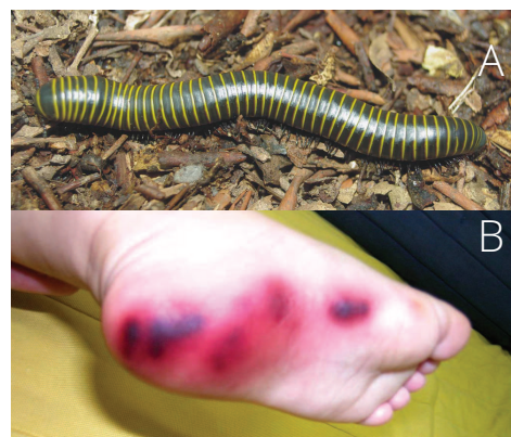
Figura 4. Acidentes causados por diplópodes. A: um espécime do gênero Rhinocricus spp. (Imagem: Rodrigues et al 2012); B: lesão causada por Rhinocricus spp. (Imagem: Capitani et al. 2011)

Quando ameaçados, muitos diplópodes se enrolam, formando uma espiral achatada (Figura 3c) ou formam uma bola (Figura 3d), como os tatuzinhos-de-jardim (crustáceos terrestres). Outros mecanismos de defesa são os ozóporos, que consistem em orifícios laterais que secretam líquidos tóxicos. A maioria das espécies não são perigosas para os humanos. Entretanto, espécies do gênero Rhinocricus spp. (Figura 4a) podem causar lesões avermelhadas na pele (Figura 4b).